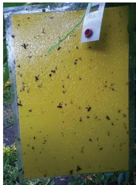
شکل ۷: کارت زرد و نحوه نصب آن روی درخت