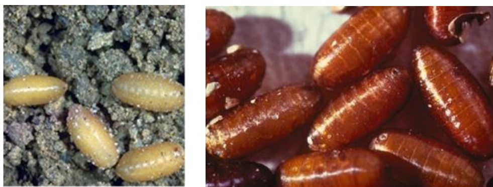
شکل ۳: شفیره مگس میوه گیلاس

شفیره: بیضوی شکل به طول ۳-۴ میلی‌متر، عرض ۱-۲ میلی‌متر و به رنگ طلایی تا قهوه‌ای روشن است (شکل ۳).