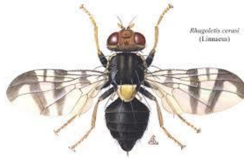
شکل شماره ۴: حشره کامل مگس میوه گیلاس

حشره ماده در انتهای شکم دارای تخم‌ریز کشیده و نوک تیز است که توسط این تخم‌ریزها، تخم‌های خود را در بافت میوه قرار می‌دهد. برخلاف ماده‌ها، در حشرات نر انتهای شکم گرد است.