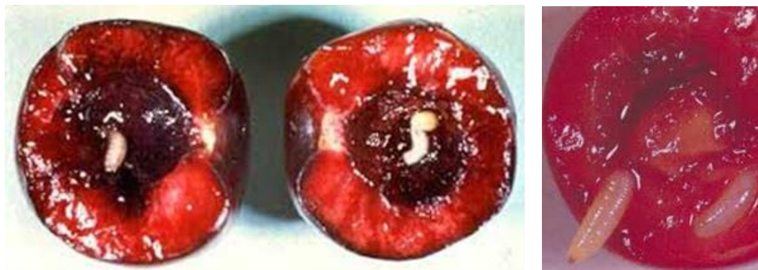
شکل ۲: لارو مگس میوه گیلاس

لارو: لاروها سفید رنگ به طول ۵-۶ میلی‌متر، بدون پا، کرمی شکل با سر باریک و نامشخص و قطعات دهانی سیاه رنگ می‌باشد. لارو جوان پس از خروج از تخم، بلافاصله به سمت عمق گوشت میوه حرکت می‌کند. رقم گیلاس با مزه ترش نسبت به رقم شیرین کمتر آلوده می‌شود (شکل ۲).